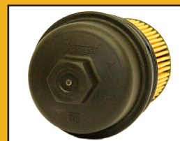
Bouchon d'huile noir HENGST

Les Filtres NAPA recommandent le filtre à huile 7674 pour le moteur GM de 1,4 litre muni du boîtier HENGST MD .