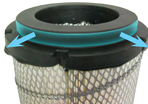
Type modifié 6907

Le joint précédent était semblable au joint d'origine (OES) qui scellait au-dessus de l'extérieur du tube de débit d'air.