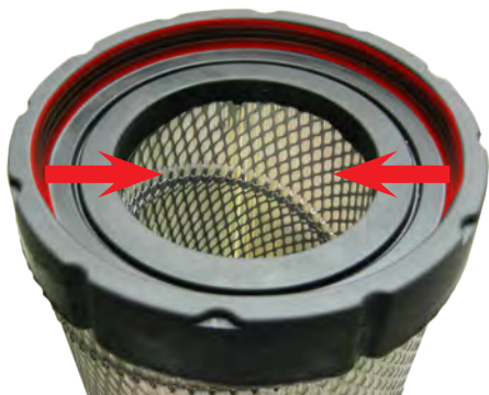
Ancien type 6907

Le filtre 6907 a fait l'objet d'une modification récente, avec un changement important du joint d'étanchéité.